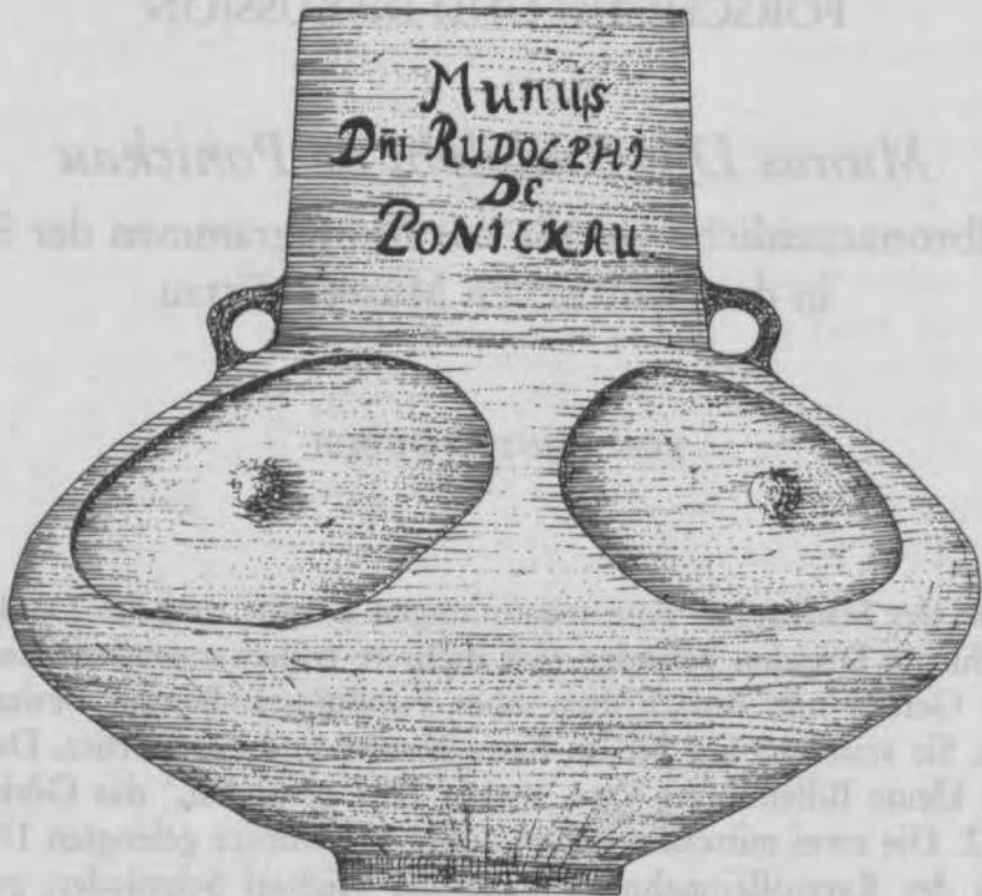
Abb.1 Mittelbronzezeitliche Buckelterrinen mit Widmung Rudolphs von Ponickau aus dem Rittergut Droben bei Milkel, Kreis Bautzen.