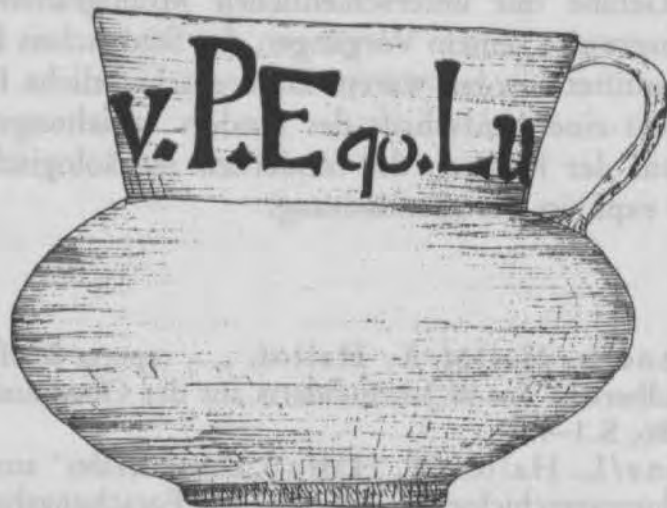
Abb.2 Mittelbronzezeitliche Kanne mit Monogramm Carls von Ponickau aus dem Rittergut Droben bei Milkel, Kreis Bautzen.